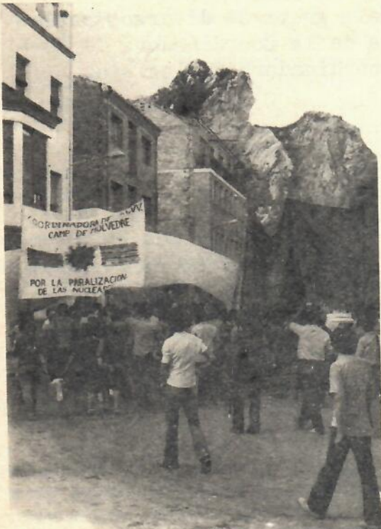
Concentració Antinuclear en Ayora. 3 de Juny. Jornada de conscienciació.