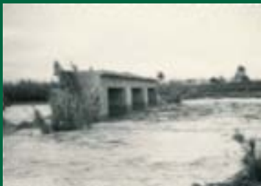
Crescudal del riu a l'altura del pont antic. Any 1967.