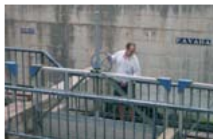
Obertura de comportes a l'assut del Repartiment.

La Comunitat de Regants de cada séquia es regeix per ordenances pròpies: les de Quart són medievals, i es remunten a 1350. En el cas que un llaurador infringisca alguna d'aquestes normes, ha de ser jutjat davant el Tribunal de les Aigües, fundat el 960