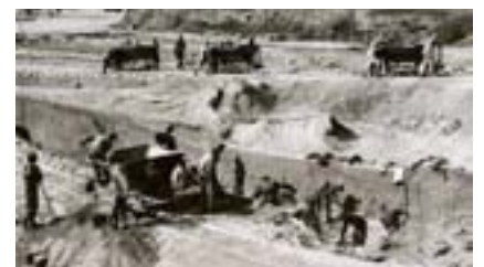
Pedrera del camp d'extermini nazi.

L'avanç de les tropes soviètiques per l'est d'Europa i el de l'exèrcit nord-americà per l'oest feia pensar que ben aviat Hitler seria vençut. El 27 de gener de 1945 els russos van alliberar el camp d'extermini d'Auschwitz, i el dia 6 de maig arribaven els nord-americans a Mauthausen: els soldats americans foren rebuts amb una pancarta que els deportats col·locaren a la part interior de la porta central on es podia llegir en espanyol, anglés i rus: " Los españoles antifascistas saludan a las fuerzas libertadoras ". La imatge que es van trobar fou horrorosa: centenars de presoners morts i amuntegats per terra, el dispensari ple de malalts agonitzant i de cossos en estat avançat de putrefacció, els barracons dels russos s'havien convertit en autèntics dipòsits de cadàvers... Finalment, el 7 de maig a Berlín, Alemanya es rendeix i finalitza la Segona Guerra Mundial a Europa. Hitler i Himmler s'havien suïcidat.