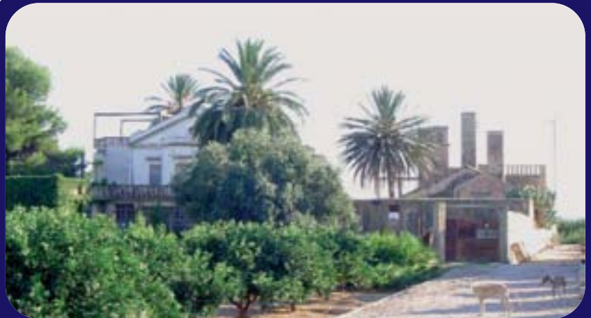
Hort de Ferrís de Catarroja.

El territori valencià s'ha convertit en un paradís per als promotors i constructors, especialment a les zones del litoral i les comarques de l'Horta, el Camp de Túria i el Camp de Morvedre