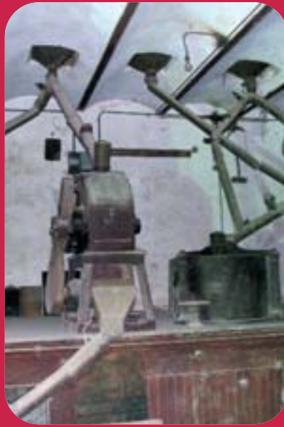
Molí arrosser de Raga (Benetússer).