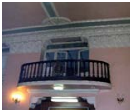
Centre Cultural i Recreatiu d'Alfafar.