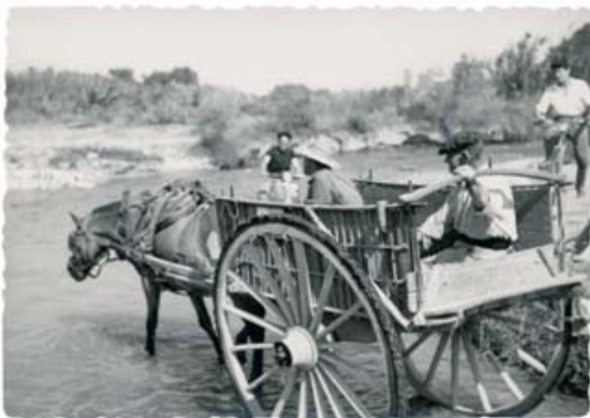
Travessant el riu en carro l'any 1961.

Quant a la séquia de l'Oro, es va construir en el segle XIX per a regar els arrossars de la Marjal, però habitualment no pren l'aigua del Túria, sinó de la depuradora de Pinedo i dels sobrants de les altres séquies.