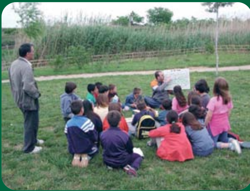
Xíquets en el riu en una de les activitats de l'Aula de la Natura.

matinada. La cisterna es troba a la plaça de l'Església, al nucli antic del municipi, mirant al riu. Actualment és utilitzada com a sala d'exposicions. En la segona meitat del segle XX, però, la gran expansió industrial va fer que el creixement del municipi s'orientara cap a la zona sud-oest del poble i l'expansió urbana generà la desaparició, que ha seguit de forma progressiva i constant, d'una part important de l'horta. El riu, amb multitud d'usos tradicionals (reg, per a fer la bugada, zona de banys o recreació, lloc per a la pesca), va emmalaltir greument per la desídia i la falta de sensibilització. La contaminació va arribar a extrems més que alarmants.