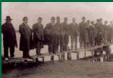
Embarcador de principis del segle XX.