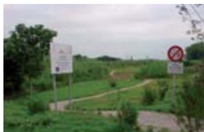
Les riberes ja recuperades.