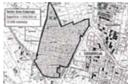
Plànol Nou Mil·lenni de Catarroja.