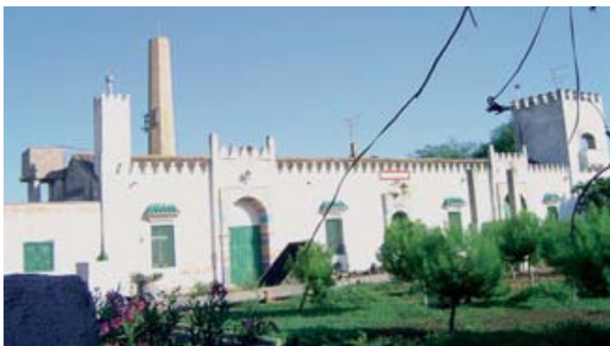
Hort de Santa Anna de Catarroja (J.L. Carretero).