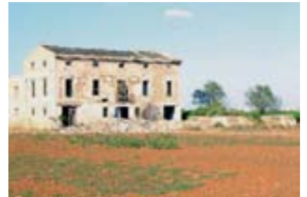
Hort dels Mestres.

L'urbanisme depredador continua, i si no li posem fre estem posant en perill la sostenibilitat del territori valencià i la qualitat de vida de les generacions futures. ■