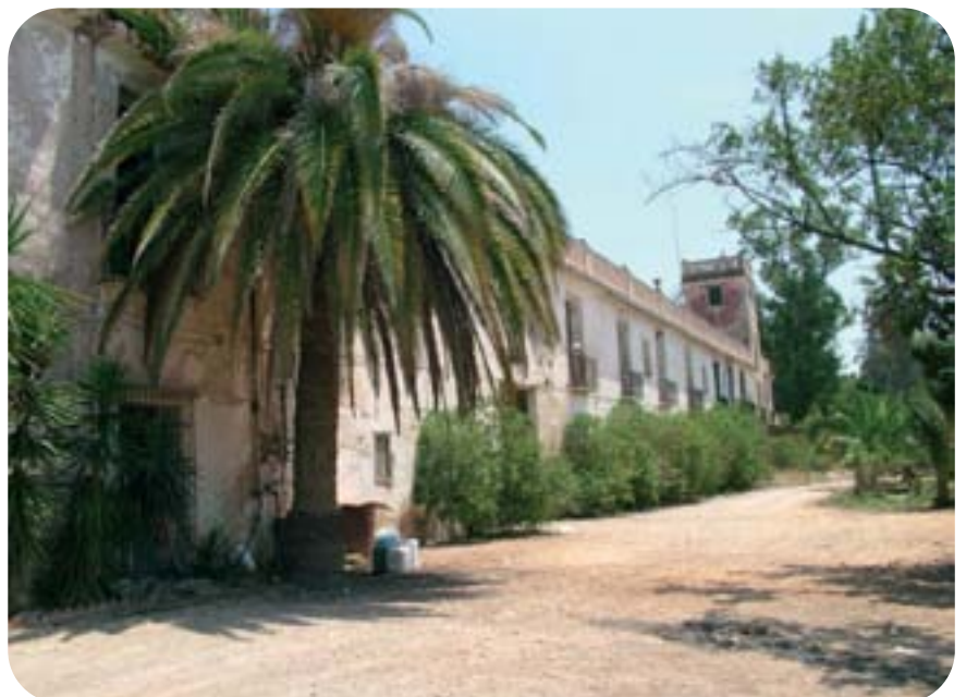
Masia de la Cova.