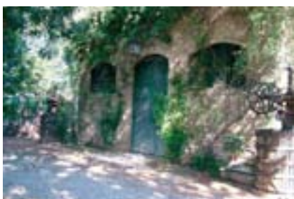
Masia d'Espinós de Manises (Enrique Deltoro)

En Compromís pel Territori estan integrats, entre d'altres, els col·lectius Acció Ecologista Agró, la Coordinadora Per l'Horta, la Plataforma per un Ferrocarril Públic i de Qualitat, les associacions de veïns de Godella, València i Guadalest, la Plataforma Xúquer Viu, el Departament de Sociologia i Territori de la Universitat de València, Adena i la Coordinadora No a la Muralla de l'AVE, de la qual formen part la Fundació Horta Sud, l'Institut d'Estudis Comarcals de l'Horta Sud i la Unió de Llaoradors i Ramaders. Altres col·lectius que han denunciat activament l'urbanisme desordenat són l'associació València Metropolitana i el Col·legi d'Arquitectes de València.