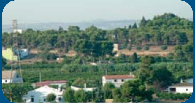
Pinada on s'ubicarà el projecte urbanístic Gran Manises.