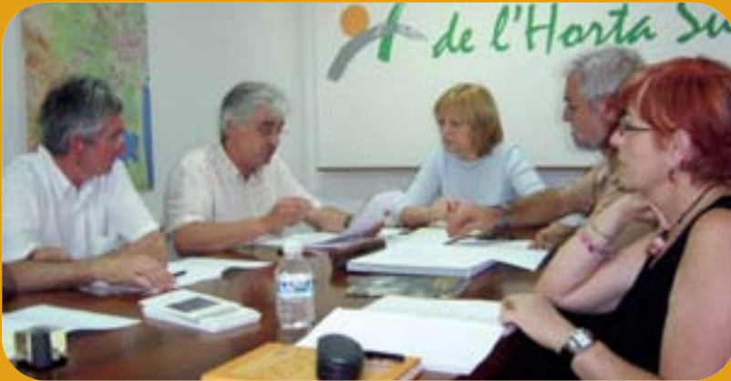
Consell executiu de la Fundació.

L'entitat premia els projectes interassociatius de huit associacions de la comarca i dos programes de solidaritat internacional