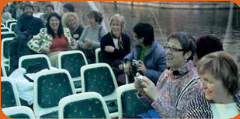
La Plataforma de Dones de l'Horta Sud visità el Parlament Europeu a Estrasburg.

L a gran majoria de les poblacions de l'Horta Sud tenen associacions de dones que treballem des de fa molts anys per la defensa dels drets de la dona, així com desenvolupant treballs de conscienciació, reivindicació i solidaritat. En algunes ocasions hem coincidit en activitats i en objectius marcats que ens han fet pensar en la possibilitat de plantejar projectes comuns.