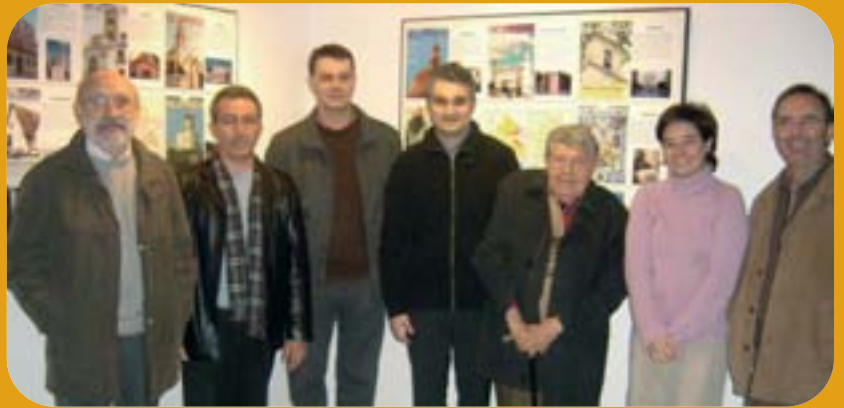
Set dels autors del llibre.

La Fundació Horta Sud recull en un llibre una recopilació d'articles publicats en la revista Papers de l'Horta sobre els vint pobles de la comarca