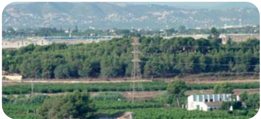
Pinada del barri de Sant Francesc.

Abusos Urbanístics No també denuncia la tendència excessiva dels ajuntaments a revisar els PGOU per a transformar sòl rústic en urbanitzable. Així mateix, uns 25 col·lectius valencians creen el passat 22 de juliol a València la Plataforma Compromís pel Territori, un moviment que reivindica una política del territori sostenible que pose límits a l'urbanisme depredador.