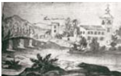
Primera representació que es coneix del pont de Quart de Poblet. És un gravat de 1690 de l'artista Juan Antonio Conchillos, en el qual es llig: "Puente de Quarte" i "Torre de Paterna".

la ciutat creuant el Túria per un punt que coincidiria amb el Pont de Catxo. El 1235 va travessar la mateixa zona, però després de reiterats fracassos va decidir finalment canviar de tàctica: va conquerir les alqueries que rodejaven la ciutat per assetjar-la i prendre-la. Ho va aconseguir el 9 d'octubre de 1238. Al pont es refereix també de manera col·lateral el privilegi que el rei Pere I ofereix a València l'1 de desembre de 1283, en concedir-li "totes les rambles per a l'ús del públic d'aquella, des del pont de Quart fins a la mar". Aquesta construcció va ser transcendental en multitud d'episodis històrics. Pel que fa a la Guerra de Successió, Escolano i Perales narren en la seua Història General de València : "Al front d'una arma de cavalleria, va baixar des d'Aragó el comte de les Torres (Borbó) (...). El comte es va establir a Montcada amb el seu exèrcit, on va decidir acampar pels pobles i alqueries de l'Horta, realitzant tota classe de destrosses (...). Davant l'arribada imminent de les tropes angleses (aliades amb l'arxiduc Carles d'Àustria), el comte travessà el Túria per Quart i es va situar a Torrent. Al seu pas cremà algunes cases de Quart i Aldaia, perquè no eren partidaris de Felip V".