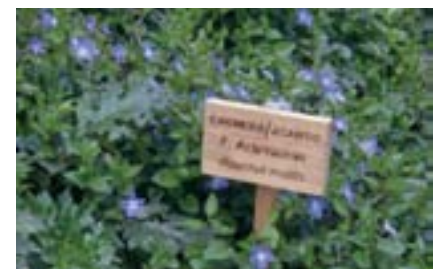
Planta autòctona de la ribera del Túria a Quart de Poblet.