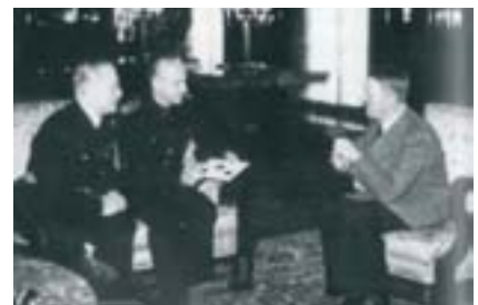
Serrano Súñer (al centre) amb Hitler.

El primer grup d'espanyols que fou deportat al camp d'extermini austríac de Mauthausen estava format per 392 republicans tots procedents de l' stalag VII-A (Moosburg bei Freising) i tingué lloc el 6 d'agost de 1940. A partir d'aquesta data, i fins al 16 d'abril del 1945, les deportacions d'espanyols es produïren de forma continuada amb la col·laboració del mariscal Pétain i amb el beneplàcit del general Franco. El govern espanyol, i en particular el seu ministre d'Afers Estrangers Ramón Serrano Súñer, estaven perfectament assabentats del martiri que estaven patint els soldats espanyols republicans, com s'ha demostrat documentalment mitjançant la correspondència que es mantingué amb el cònsol espanyol a Viena i l'ambaixador espanyol a Berlín. La deportació a Mauthausen continuà periòdicament fins a vint dies abans de l'alliberament per les tropes aliades: el 5 de maig de 1945.