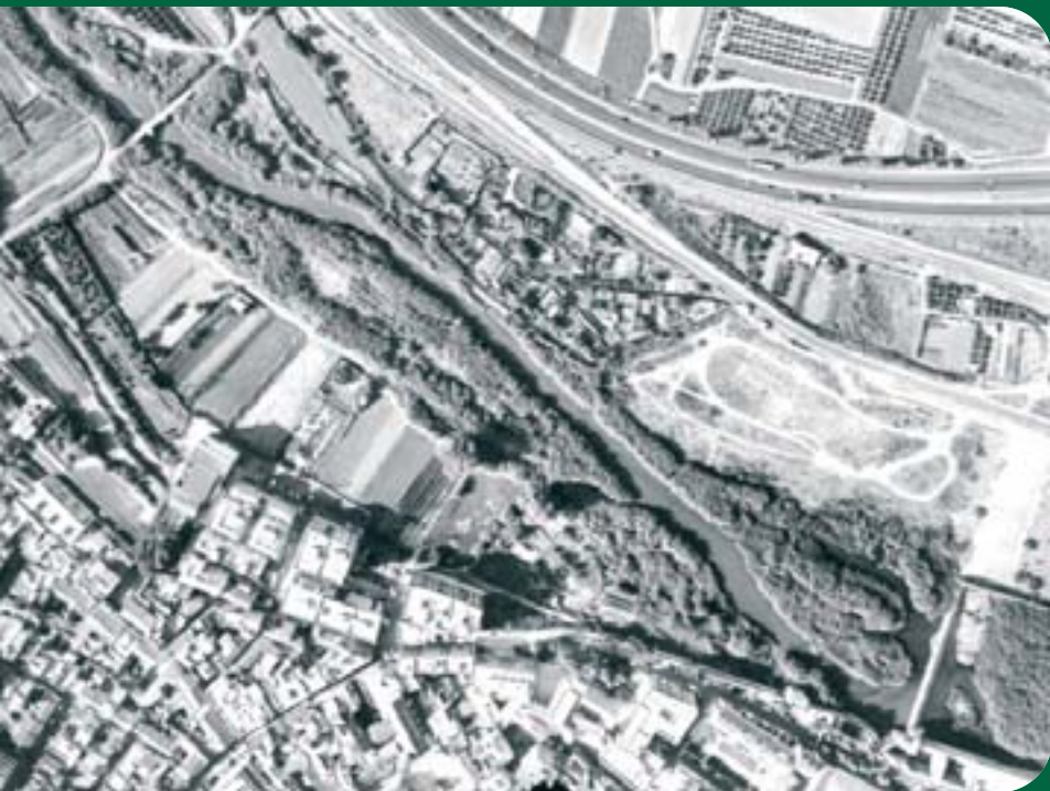
Vista aèria del riu Túria a Quart de Poblet.

La història de Quart de Poblet està lligada a la poderosa riquesa d'un Túria que va donar generosament la seua aigua per a alimentar una agricultura rica i pròspera, una incipient indústria, molins de producció important, i que, en ocasions, va tornar el somni de prosperitat en malson amb crescudes devastadores.