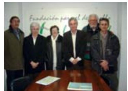
Representants de les ONG subvencionades en el Programa de Solidaritat Internacional.

També ha estat subvencionada amb 1.500 euros l'ONG AEDIHAL del barri La Joya de Bucaramanga (Colòmbia) per tal de contribuir a finançar un menjador assistencial i de prevenció de l'absentisme escolar per a xiquets. ■