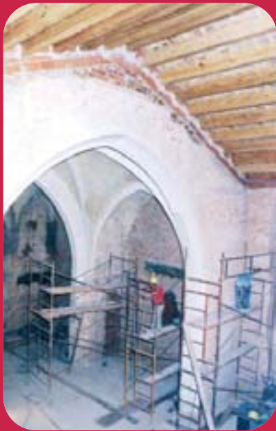
Ermita de Santa Anna d'Albal.