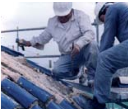
Treballs de restauració de la cúpula de l'ermita de la Mare de Déu de la Vallivana.