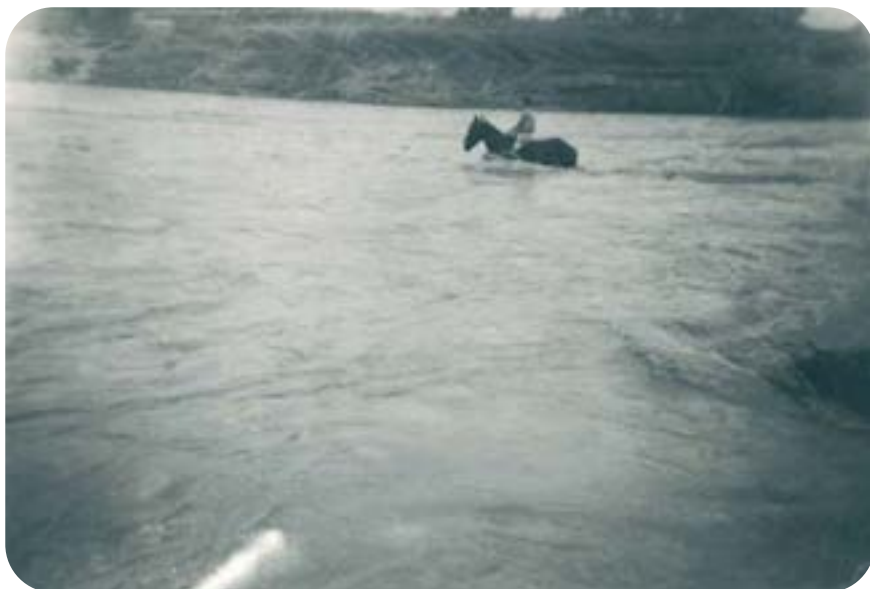
Un home travessa a cavall el riu en la riuada de 1957 a pocs metres aigües avall del pont.

Durant els anys 20 s'ha documentat, així mateix, el funcionament d'un embarcador, que possiblement va desaparèixer una dècada després. El barquer conduïa la barca i cobrava pel pas. Aquest fet posa de manifest la dificultat de travessar un pont que durant molt de temps tingué un pendent important. Això obligà a construir un gual pel qual creuaven els carros. Per a fer-lo més viable s'omplia de grava estreta del riu.