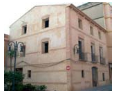
Casa del segle XVIII d'Aldaia.