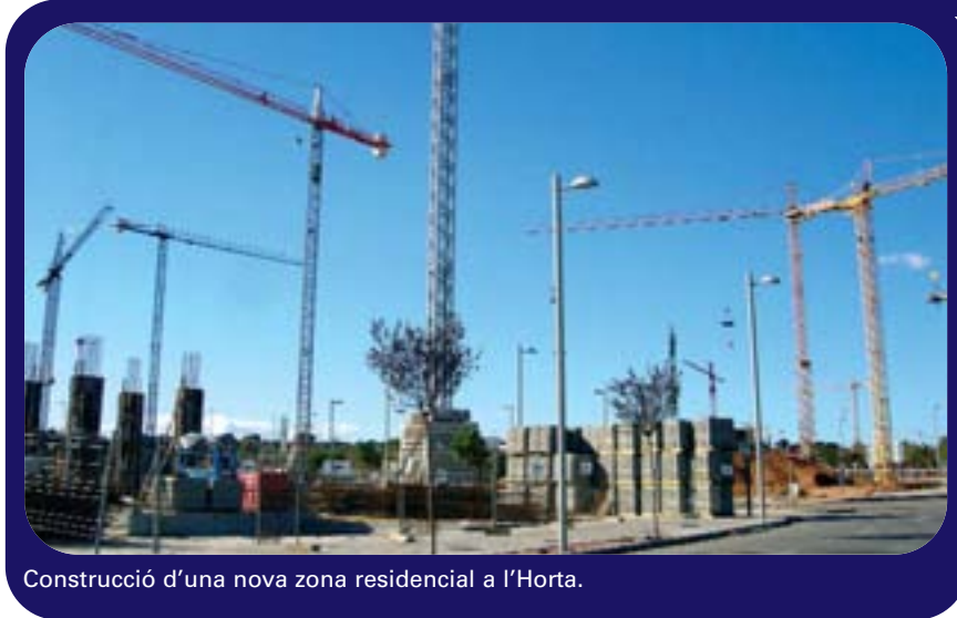
Construcció d'una nova zona residencial a l'Horta.

L'autor proposa un pacte urbanístic entre els dos partits majoritaris de les Corts Valencianes, PP i PSPV, per tal d'aminorar la febra urbanitzadora, facilitar l'accés a la vivenda i racionalitzar el desgavell urbanístic que impera a l'Horta.