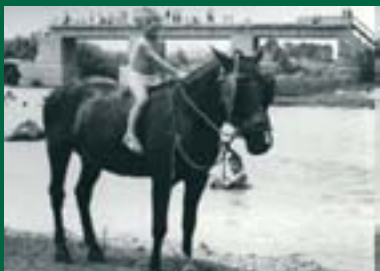
Banyes en el riu en els anys 60.