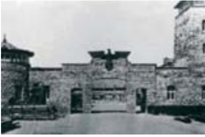
Camp de Mauthausen.