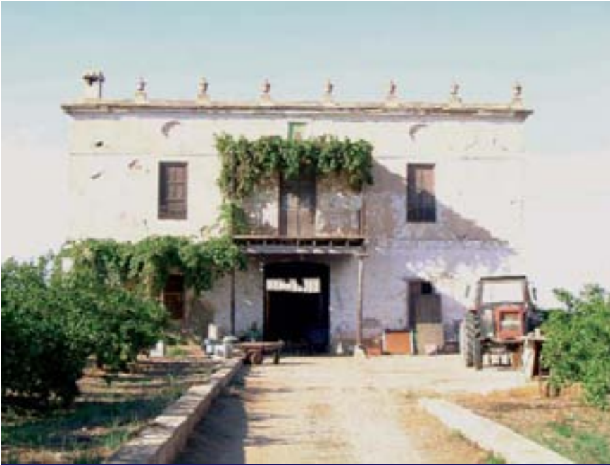
Hort del Groc de Catarroja (J.L. Carretero)

La Comissió Europea –a petició del Parlament Europeu– ha recomanat a la Generalitat Valenciana una moratòria urbanística, és a dir, la no reclassificació de més terrenys per a construir, i també la paralització dels PAI en tramitació fins que no s'aprove la LUV.