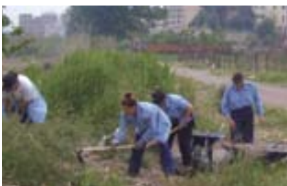
Treballs de regeneració.

La redacció d'aquest article ha estat possible gràcies a la informació facilitada per l'Agència de Desenvolupament Local de Quart de Poblet.